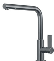
Mitigeur Omega Gun Metal 8497 856