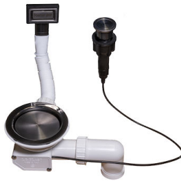
Vidange automatique Space Push Gun Metal - PO