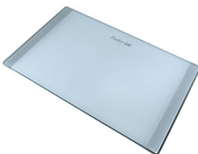
Planche de découpe en verre 8633 300